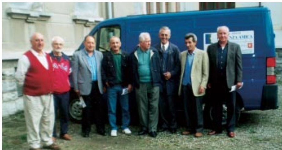
Il nuovo furgone di Presenza Amica per la consegna a domicilio dei presidi sanitari

Un grazie a Presenza Amica da parte di tutta l'équipe per il sostegno e l'amicizia di questi difficili dieci anni, pieni di lavoro, dedizione ed entusiasmo.