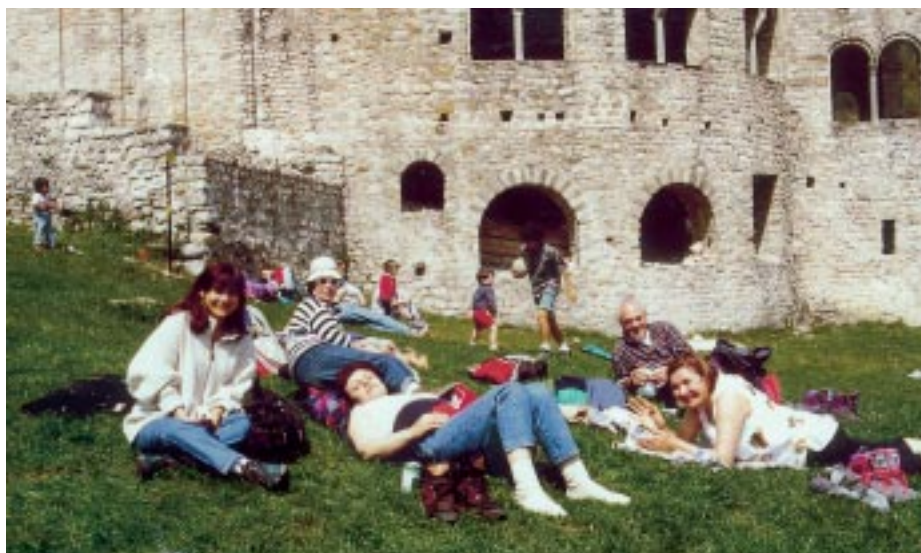
La gita a S. Pietro in Civate

Per proporre iniziative per il loro tempo libero, nel giugno 95 nasce il gruppo "Quelli del giovedì" che, quasi subito,