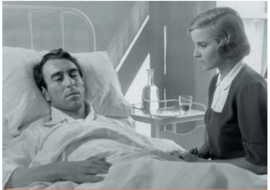
Giuliano Montaldo e Antonella Lualdi nel film "Cronache di poveri amanti" (1954)