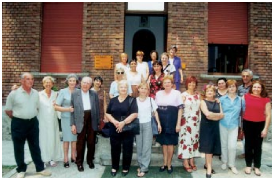
La nuova sede di Presenza Amica

I primi anni hanno visto aderire principalmente persone che volevano fare