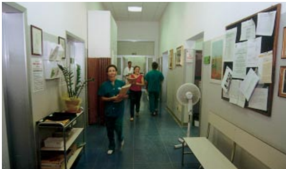
L'interno della sede dell'U.C.P.T.D.

All'Ospedale di Garbagnate, nel padiglione Ovest, è ormai ultimata una prima sezione di 10 posti letto che sarà gestita dall'équipe della UCPTD. Si tratta di un primo importante intervento, ma