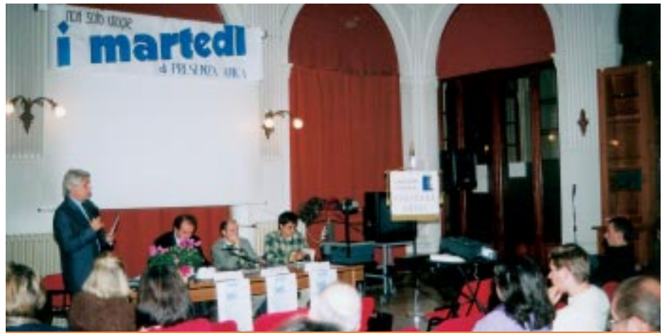
Un incontro dei "Martedì..."

L'attività di supporto diretto potrà essere rappresentata dal coinvolgimento dei volontari in aree assistenziali che non determinino un incremento di spese per l'associazione, tali da rendere necessari interventi di rifinanziamento per i quali diventi obbligatorio stipulare rapporti convenzionati con le Istituzioni. Un interessante esempio è rappresentato dall'attivazione del servizio di consegna a domicilio dei presidi più ingombranti: da settembre, un gruppo di volontari autisti di Presenza Amica inizierà questa importante attività di supporto alla UCPTD ed i malati riceveranno al proprio domicilio lettini, materassini antidecubito ecc., trasportati con il furgone di Presenza Amica. Un terzo obiettivo sarà il mantenimento della continua crescita culturale nel settore dell'intervento a sostegno delle persone inguaribili: tutela dei diritti del morente, analisi del ruolo della famiglia, approfondimento degli spazi per il terzo settore, proposta di modelli di interventi a rete nella quale, oltre ai Soggetti Sanitari (Aziende Sanitarie e A.S.L.), ritrovino un ruolo specifico i Comuni, saranno i temi sui quali, nei prossimi anni, verranno organizzati incontri, conferenze e corsi. L'incontro di sabato 28 Settembre "Le organizzazioni non profit: dal volontariato all'erogazione di servizi" rappresenta un primo esempio di questa linea di sviluppo. Vi è poi un'area nella quale l'intervento delle Organizzazioni non pro-