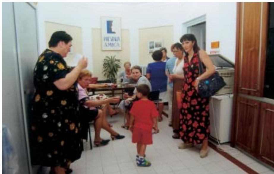
L'interno della sede di Presenza Amica

inesperienze, panico e disagio e spesso anche solo con la loro muta presenza, riescono a far stare meglio i famigliari e il paziente.