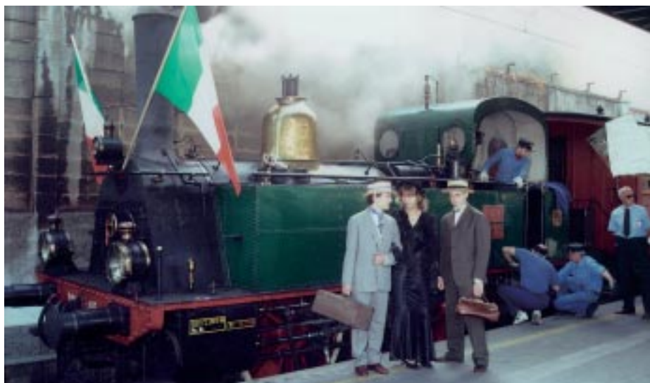
La locomotiva più vecchia d'Europa ci ha portati a Como