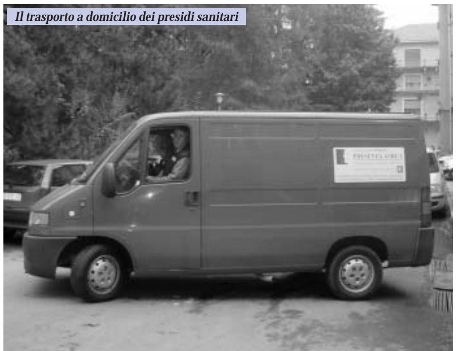
Il trasporto a domicilio dei presidi sanitari

Per il confronto, lo scambio di esperienze e l'amicizia ci sono però tante altre occasioni all'interno dell'Associazione.