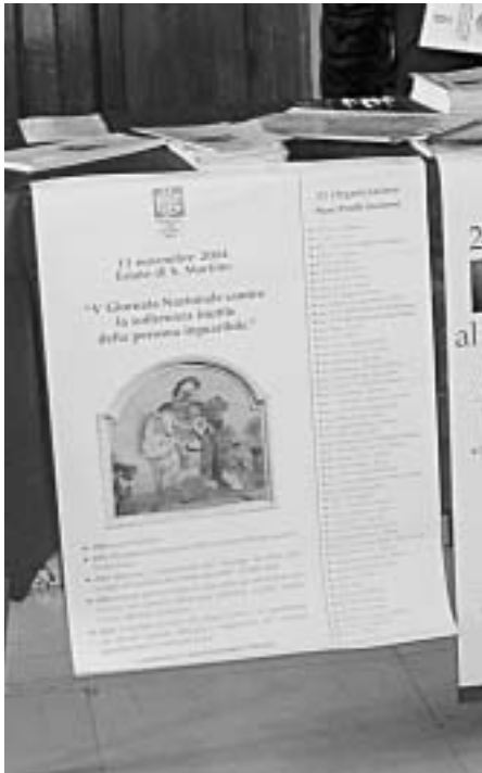
Una delle postazioni di Presenza Amica