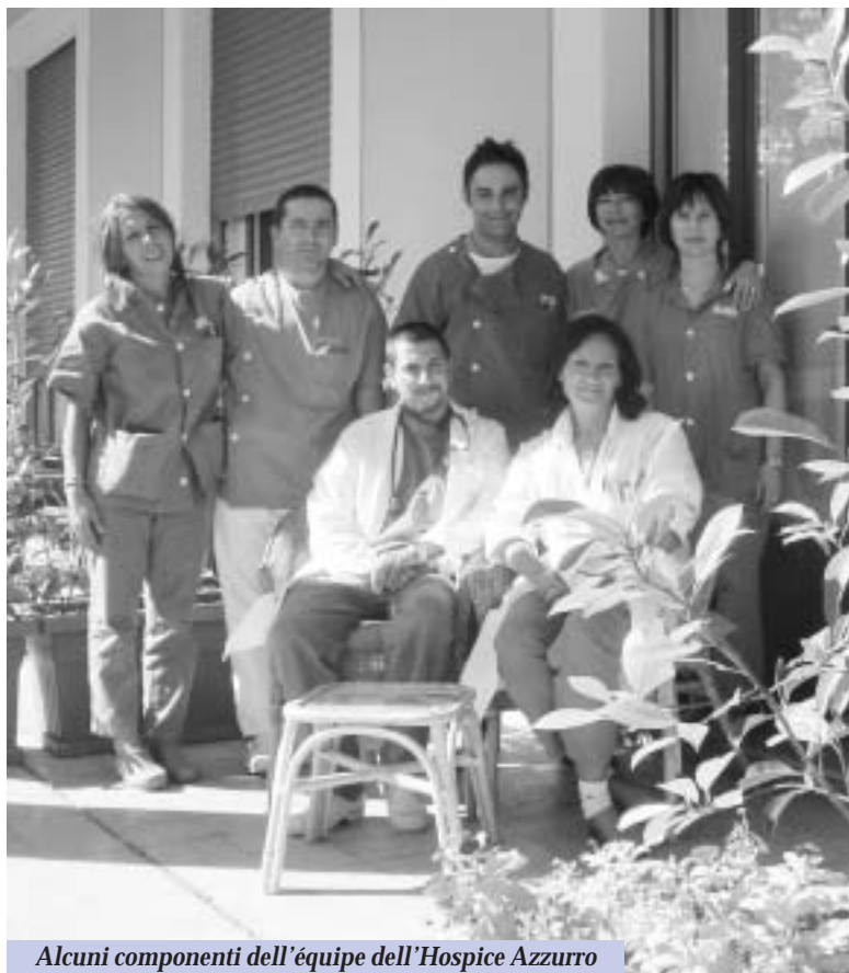
Alcuni componenti dell'équipe dell'Hospice Azzurro

Le parole e i messaggi dei pazienti che abbiamo fin qui assistito e dei loro familiari ci inducono a credere che abbiamo cominciato a percorrere un cammino scegliendo la direzione giusta. Certo si può ancora migliorare, ma tutto lascia presupporre che, con l'aiuto di tutti gli operatori, dei volontari e di quanti ci aiutano, il nostro lavoro sarà sempre più qualificato.