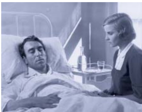
Giuliano Montaldo e Antonella Lualdi nel film "Cronache di poveri amanti" (1954)

Il "dolore totale" del malato terminale sul quale si vogliono fondare le giustificazioni all'atto eutanasico oggi è un "dolore" che può essere lenito, da un lato con adeguate terapie farmacologiche, patrimonio peculiare ed esclusivo delle Cure Palliative, e dall'altro con il giusto conforto umano, affettivo e spirituale che solo un approccio olistico può garantire al malato inguaribile.