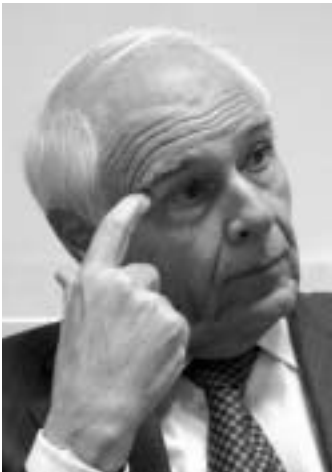
Il ministro della Salute Girolamo Sirchia

Dopo anni di discussione finalmente anche l'Italia si allinea agli altri paesi europei: è quanto dichiarato dal ministro